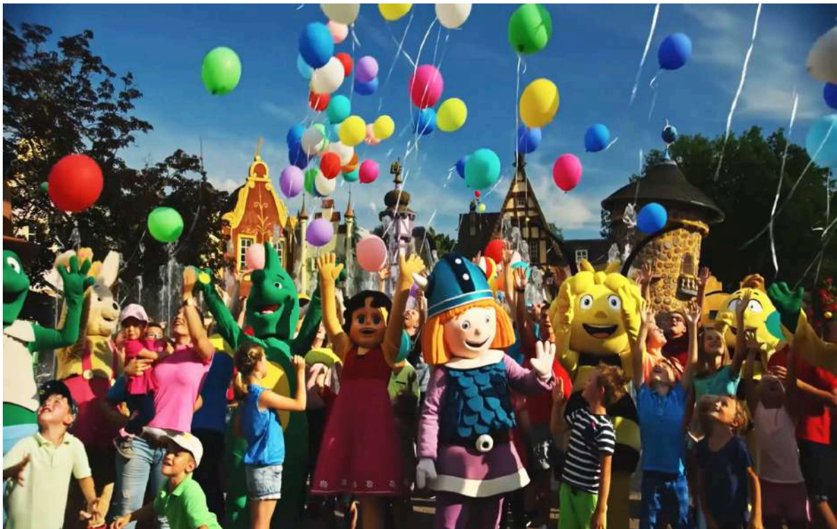
afbeelding van Studio 100 Group

Wij gaan naar Spanje, want daar kan je samen rijden op de moto. Van te reizen krijg je vleugels. Onderweg zagen wij 10.000 luchtballonnen in alle kleuren. We hadden geluk, er was geen storm op zee en we konden wel 10 kleine visjes spotten! Het is lente, dus we hoeven de regendans niet meer te doen en kunnen vrolijk de kabouterdans op repeat zetten. Niet super stoer, maar ik ga nu mijn geheim verklappen: het wordt een top-activiteit!